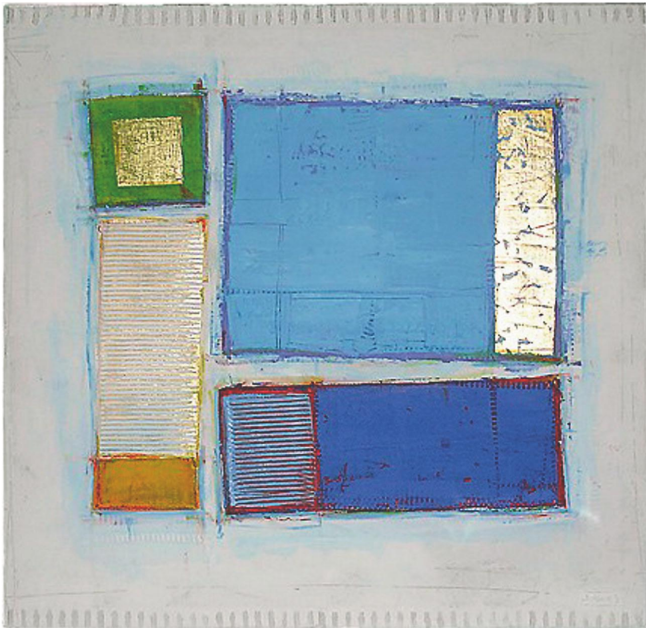
Jonas Bergstedt maler med akryl på seilduk.